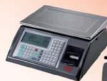
3400 BA - 3400n (acn)