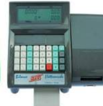
Grigio RAL 7010