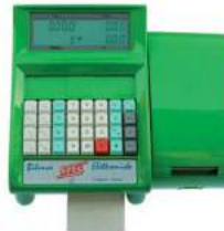
Verde RAL 6018