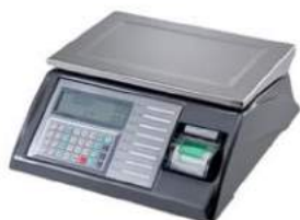
Ego 2000 BA