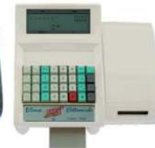
Bianco RAL 9003