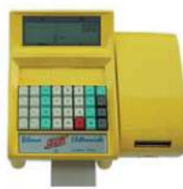
Giallo RAL 1018