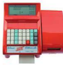
Rosso RAL 3020