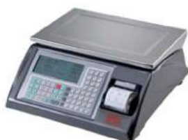
Ego 3400 BA