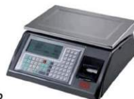
3600 BA n-lab