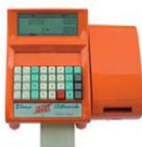
Arancione RAL 2004