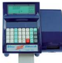
Blu RAL 5022